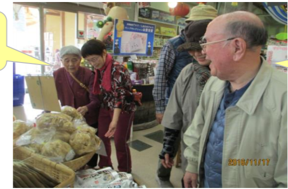
ほんと、 それは多過ぎ ばい。