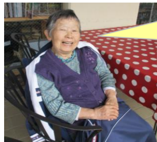
外に出るのも 楽しいね♪