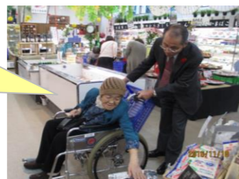
あ～ これば探し よったと。