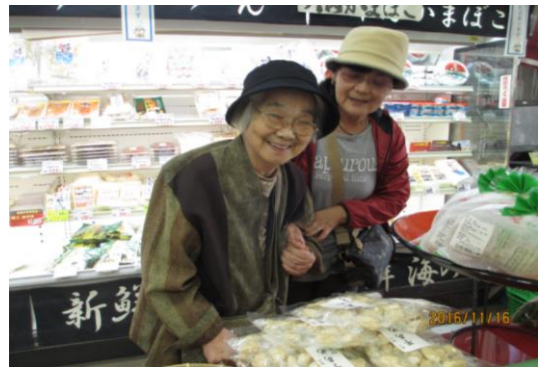
魚の きれかね～。 本日の目玉は