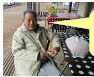
孫に カステラば 買った。