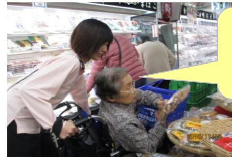
これは、 期限は いつまでって