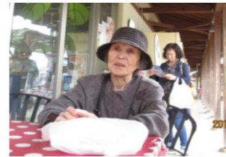
はい。 買い忘れは ありませーん。