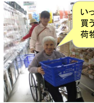
いっぱい 買うけんね！ 荷物持ちよろしく。