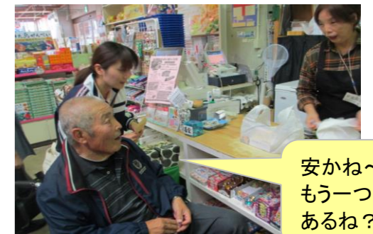
安かね～ もう一つ あるね？