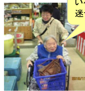
いろいろあって 迷うね～